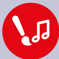
Kultur - Gestalten