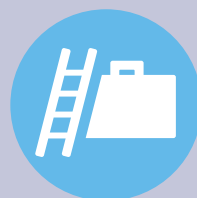
EDV / Beruf